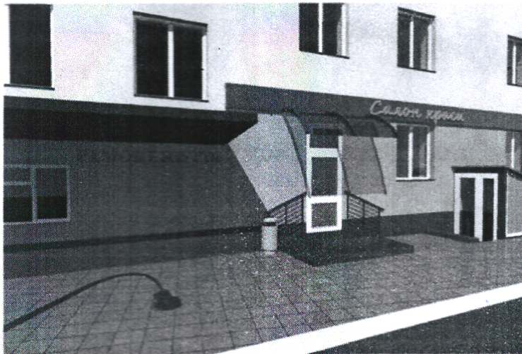
"Реконструкція квартири №108 під магазин промислових товарів та салон краси по вул. Шевченка, 2 в м. Фастів Київської області"